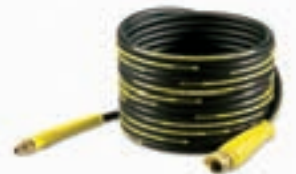
Skarvslang från Kärcher, pris 950 kr.

♦ Alla har inte så låga hus så att maskinen kan stå på marken när man jobbar på taket. Det är sällsynt att slangen räcker upp. Och att baxa med sig en tung hjulförsedd högtrycksvättmaskin på det lutande taket är inget man längtar efter. Med en skarvslang som kopplas mellan ordinarie slangen och handtaget kan man låta högtrycksvättmaskinen stå kvar på marken. En tio meter lång sådan är dyr, kostar runt tusenlappen. Men det kan det kanske vara värt.