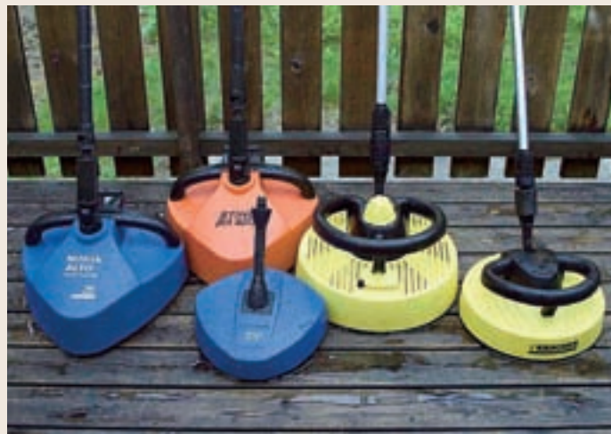
Terrasssvättparad, från vänster Nilfisk-Alto Patio Cleaner, Stihl RA 10, Nilfisk-Alto Copact Patio Cleaner, Kärcher T-Racer T 300 och Kärcher T-Racer T200.

Denna är i princip identisk med Nilfisk-Alto Patio Cleaner. Den är orange och kommer lite mer monterad i en större kartong jämfört med Nilfisk-Altos variant. En annan skillnad är att Stihls munstycken är lite mer påkostade. De är av mässing, hos Nilfisk-Alto är de av plast. Vi hade inga problem att montera Stihlmunstyckena i Nilfisk-Alto Patio-Cleanern. Men vi hann aldrig provköra. Sannolikt är detta en smart uppgraderingsmöjlighet för ägaren till en Nilfisk-Alto Patio-Cleaner.