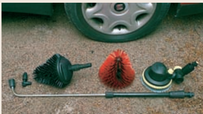
Ovanför Kärchers långa underspolningsrör för 395 kr syns från vänster Nilfisk-Altos vinklade munstycke för 235, samma märkes roterande borste med hård svart borst för 495 kr och röda mjukare utbytesborst för 245 kr. Sist en vinklad roterande borste från Kärcher för 515 kr.

Tvättmedlen för biltvätt med högtryckstvätt uppges vara tämligen oförargliga kemikalier som är nedbrytbara i naturen. Däremot så är den smuts som tvättas bort från bilen inte harmlös. Här hittar vi asfaltpartiklar som vinterdäckens dubbar har rivit upp, gummipartiklar, restprodukter från bensin och diesel med mera. Plätten för biltvätt bör alltså väljas med viss omsorg. Alltså inte där små barn leker eller platsen för det blivande grönsakslandet.